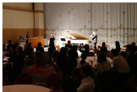
ナイトセッション