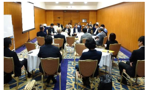
ラウンドテーブル