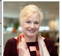
正宗エリザベス氏