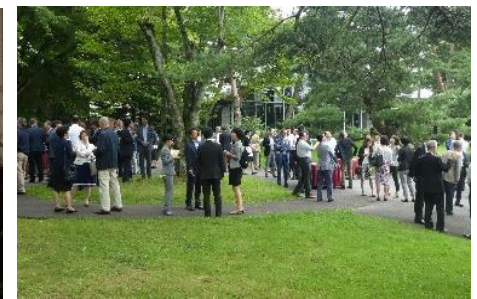
コーヒーブレイク