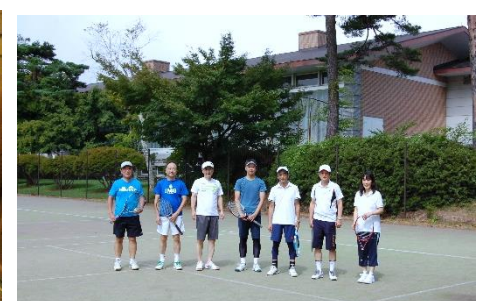
プレ・ポストプログラム