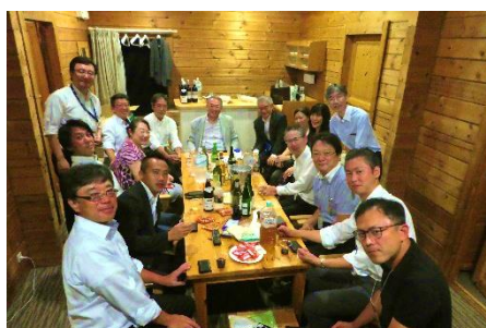
コテージセッション