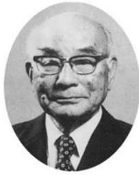
第2代会長 土光 敏夫 1973.5～1982.5