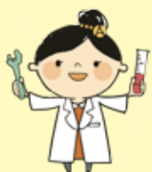
内閣府 理工チャレンジ(リコチャレ) イメージキャラクター リコちゃん