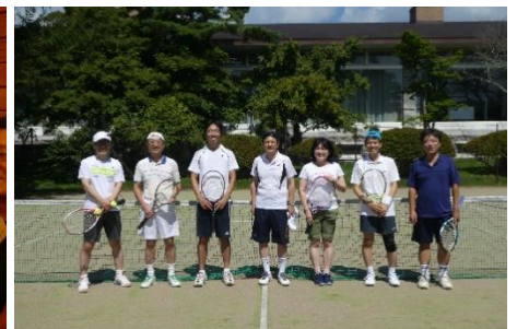
オプションプログラム(当日実施)