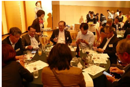
ナイトセッション