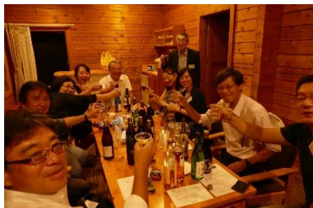
コテージセッション