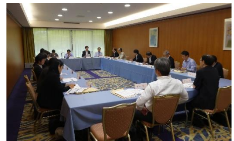
ラウンドテーブル