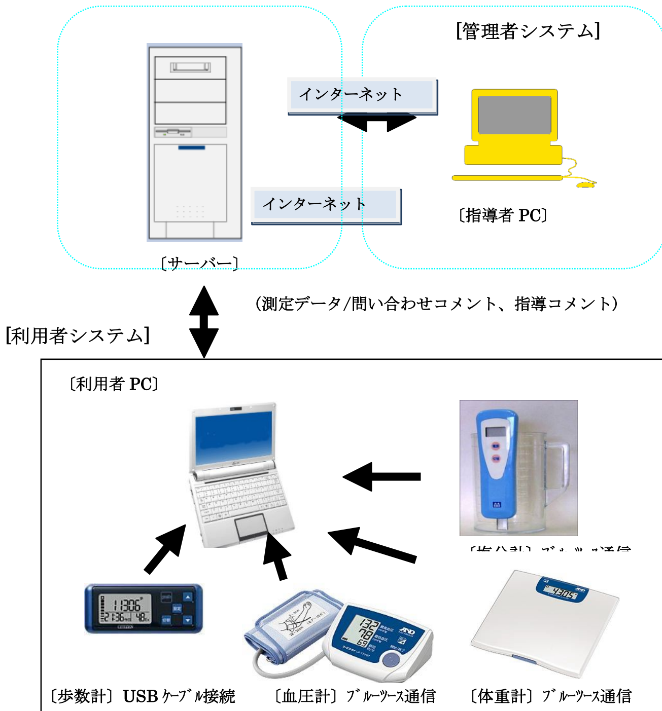
図1 システム 概要